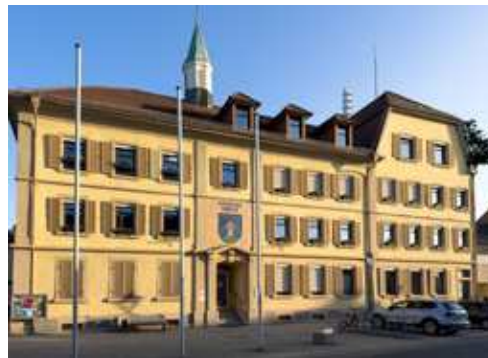
Ehemaliges Schulhaus: das heutige Rathaus.

Die Bevölkerungszahl stieg kontinuierlich auf 2800 vor dem Ersten Weltkrieg. Nach dem Krieg entwickelte sich Forst rasant. Kies- und Sandvorkommen sorgten für den Aufschwung, der durch die ideale Verkehrsanbindung an die Autobahn und Bundesstraßen begünstigt wurde. Namhafte Unternehmen wurden gegründet oder siedelten sich neu