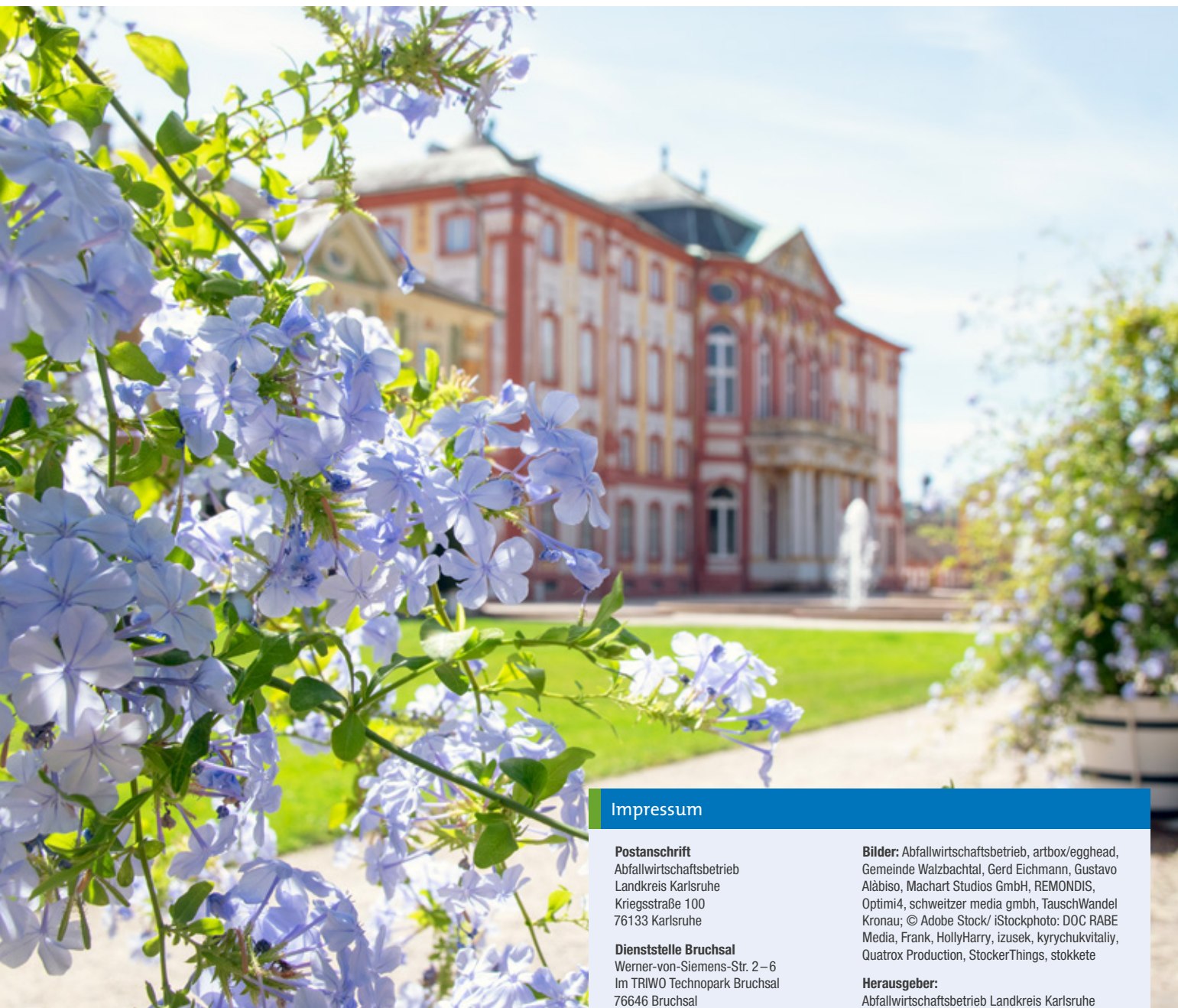
Blütenpracht vor barocker Kulisse: Schloss Bruchsal.

Infos zur Abfall App KA unter www.awb-landkreis-karlsruhe.de/abfallapp Gebührenfrei verfügbar für Android und iOS