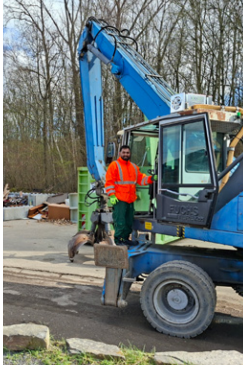
(Bild links) Auch bei der Einfahrt finden Anliefernde Infos zur Unterscheidung Restabfall und Restsperrmüll