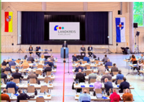
Mit der Festlegung des Kreistags auf das Gelände in Bruchsal beginnt die Planung für die neue Deponie der Klasse II für mineralische Abfälle.

Es geht um eine Größenordnung von jährlich 37.000 Megagramm (Tonnen) inertes Material wie Straßenaufbruch, belasteter Bodenaushub, Produktionsabfälle wie Kesselasche oder