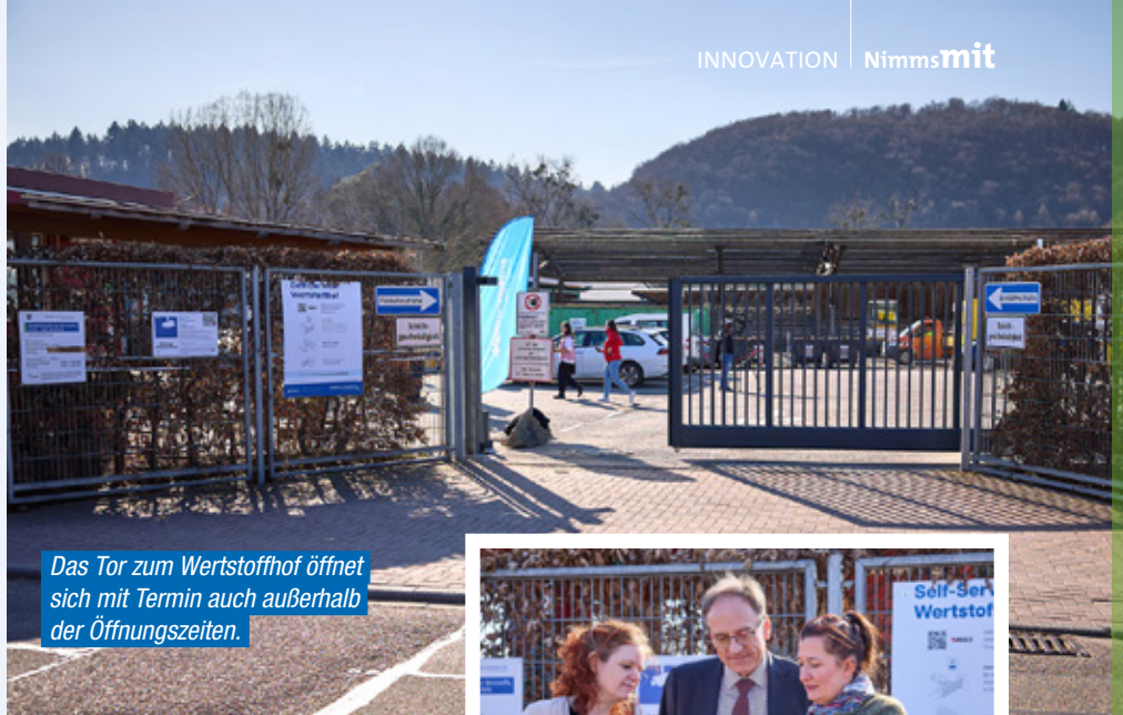
Das Tor zum Wertstoffhof öffnet sich mit Termin auch außerhalb der Öffnungszeiten.

Der erste Self-Service Wertstoffhof im Landkreis Karlsruhe wurde offiziell in Betrieb genommen. Bürgerinnen und Bürger können ihre Wertstoffe dort ab sofort auch außerhalb der regulären Öffnungszeiten flexibel und eigenständig abgeben.