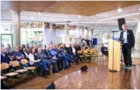
Gut besuchte Infoveranstaltung in Bruchsal.

Rückstände aus Eisengießereien und auch um Abfälle aus kerntechnischen Anlagen, die „freigemessen“ sind, das heißt unterhalb der Strahlungsgrenzwerte liegen aber nicht direkt in die Wiederverwertung gehen können. Aber auch Privatleute sollen dort haushaltsübliche Mengen von Asbestabfällen wie alte Welleternitplatten oder Mineralfaserabfälle hinbringen können. Über einen Zeitraum von 60 Jahren wird mit einer gesamten Einbaumenge von 2,2 Mg gerechnet, was einem Volumen von 1,3 Millionen Kubikmetern entspricht.