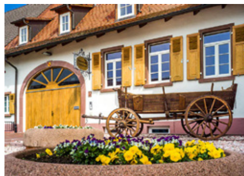
Heute Ort für kulturelle Veranstaltungen: Das Heimathaus Zehntscheuer.

Auch der Vogelpark, eingebettet in eine parkähnliche Anlage, bietet die Möglichkeit, zahlreiche Vogelarten und Kleintiere zu beobachten. Die Sternwarte auf dem Pausenhof der Grundschule Hochstetten lädt Interessierte zu einer Reise durch das Universum ein, während der Baumlehrpfad in Hochstetten Wissenswertes über unsere heimischen Wälder vermittelt. ■