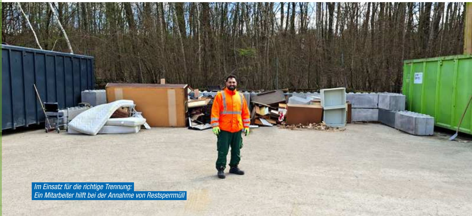
Im Einsatz für die richtige Trennung: Ein Mitarbeiter hilft bei der Annahme von Restsperrmüll

Nach Bruchsal fahren statt auf die Straße stellen