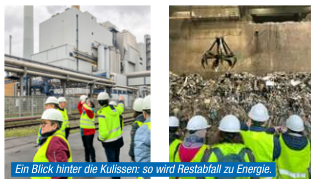
Ein Blick hinter die Kulissen: so wird Restabfall zu Energie.

Dort wurde der technische Aufwand ersichtlich und gleichzeitig wurde sichtbar, wie viel Müll tatsächlich anfällt und Tag für Tag behandelt werden muss. Insgesamt sind sich alle einig, dass der Abfalltransport per Schiene die beste Lösung ist. ▀