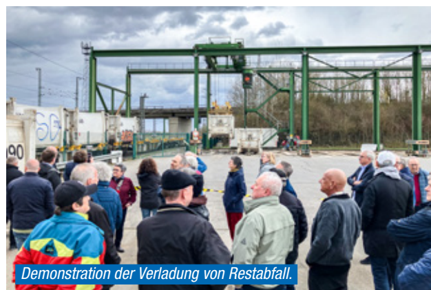
Demonstration der Verladung von Restabfall.

→ Am 11. März haben 35 Kreisrätinnen und Kreisräte, vornehmlich Mitglieder des Ausschusses für Umwelt und Technik, der gleichzeitig Betriebsausschuss für den Abfallwirtschafts-betrieb ist, den Weg des Hausmülls von der Anlieferung an der Müllumladestation am Entsorgungszentrum Bruchsal bis zum Müllheizkraftwerk in Mannheim (MVV) nachvollzogen.