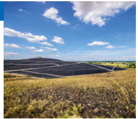
Hier soll eine Deponie auf der Deponie entstehen