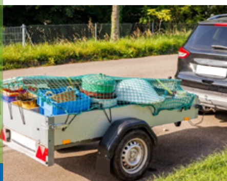
Unterwegs zum Entsorgungszentrum. Aber Achtung! Vielleicht ist nicht alles auf dem Anhänger Restsperrmüll – entscheidend ist die Größe.

Genauer gesagt: Ein kaputter Koffer, ein großer Teppich oder eine Matratze ist Restabfall, aber zu groß für den Restabfallbehälter und somit Restsperrmüll. Ein kleiner Teppich ist ebenfalls Restab-