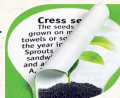
Beispiel 1-fb Druck unter dem Aufkleber