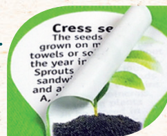
Beispiel 1-fb Druck unter dem Aufkleber